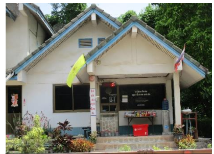
สำนักงานโรงไม้หิน