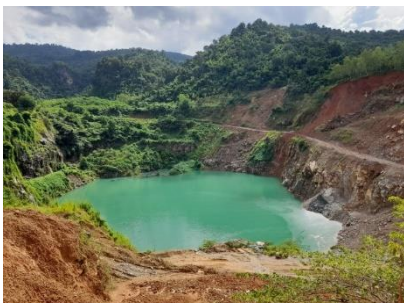
พื้นที่หน้าเหมือง