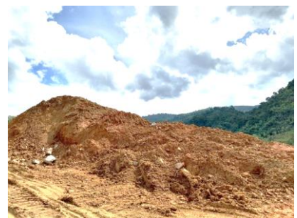
พื้นที่เก็บของเปลือกดิน