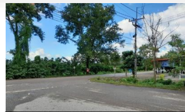
ทางหลวงหมายเลข 1115