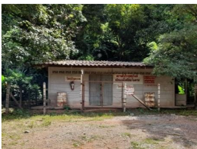
อาคารเก็บวัสดุระเบิด