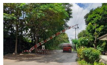
บริเวณด้านหน้าทางเข้า-ออก พื้นที่โครงการ