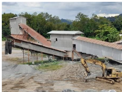
โรงไม้หินของโครงการ