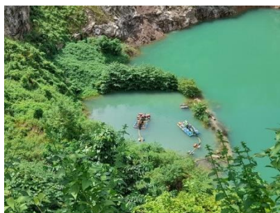
บ่อดักตะกอน